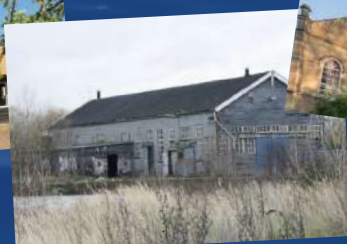
Scheepswerf van Duijvendijk