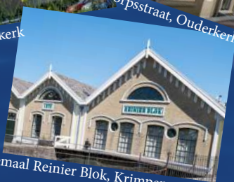
Gemaal Reinier Blok, Krimpen