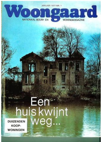
Villa Hitland in blad van 1977 (voorop ca 1935)