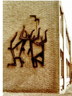
Kunstwerk Prins Bernhardmavo

Oudheidkamer 's-Gravenweg 6a geopend: elke eerste zaterdag van de maand van 14.00 uur - 17.00 uur, Open Monumentendag (alle gratis) en op afspraak (betaald). Toegangsprijs groepen: €1 pp met een minimum van €25 (maximaal 40 p.) Afspraken: voor groepsbezoeken tel. 0180-312228, voor schoolbezoeken 06-22869409. Voor meer informatie: www.hvnweb.nl