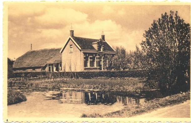
Boerderij 's-Gravenweg 18