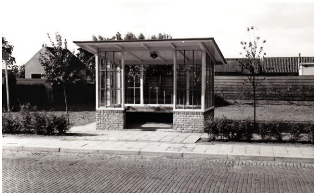
Gemeentelijk bushokje van baksteen en staal aan de Kerklaan