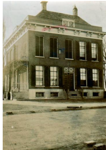
Villa Spreeuwenhoek Kortenoord