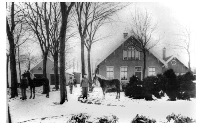
Boerderij Batavier Batavierlaan