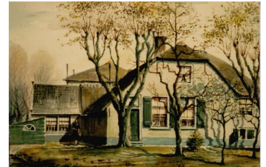
Boerderij 's-Gravenweg B-127 door J. Verheul (1928)