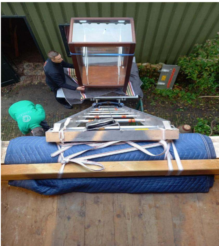
Figuur 4 De verhuislift