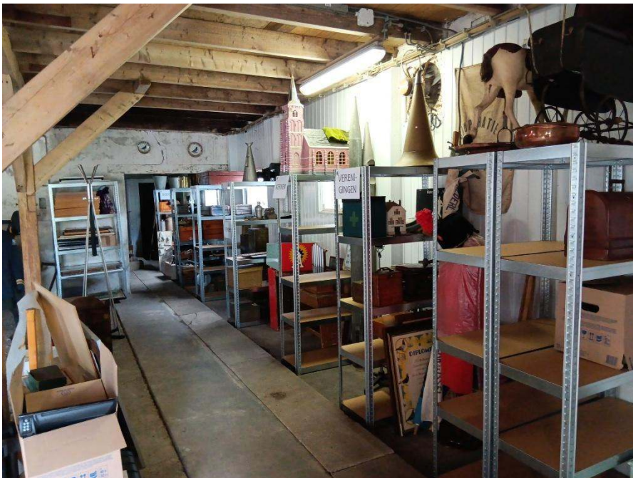
Figuur 2 Netjes in de opslag