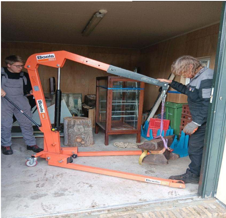
Figuur 3 Aambeeld van 200 Kg in de takel