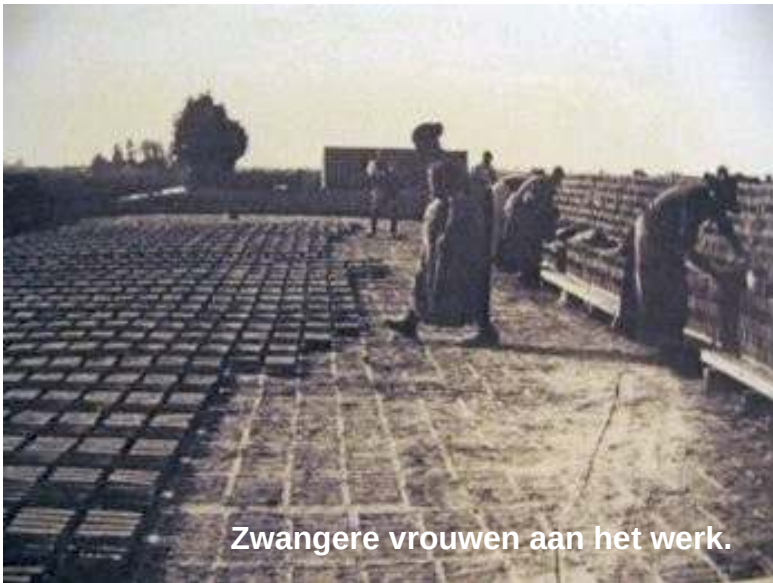
Zwangere vrouwen aan het werk.

't Was allegaar arremoe. De gekregen kleding werd door de moeders 's nachts met allerlei gekleurde restjes stof versteld, gelijk een clownspak. Overdag mos moeder ok werreke op de plaas. An 't end van de week was je doodmoe en mos je zondags verplicht van de baas naar de kerk.