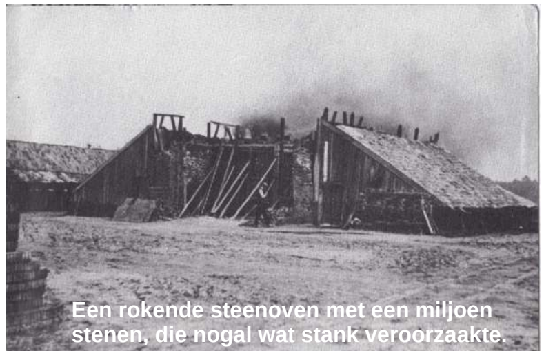
Een rokende steenoven met een miljoen stenen, die nogal wat stank veroorzaakte.