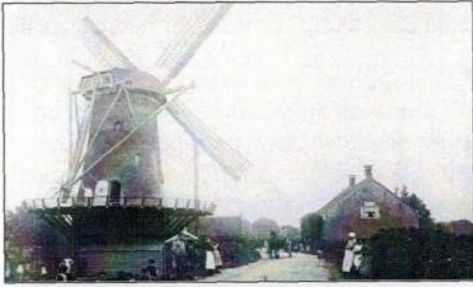
Molen 'Windlust' in de oude staat.