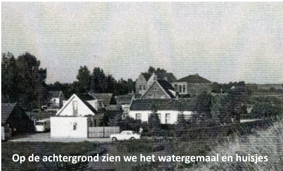
Op de achtergrond zien we het watergemaal en huisjes